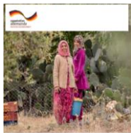
L'auto-organisation des femmes Un outil de renforcement de la participation des femmes au développement Document d'orientation

La participation des femmes dans l'agriculture durable et la gestion des espaces naturels ;